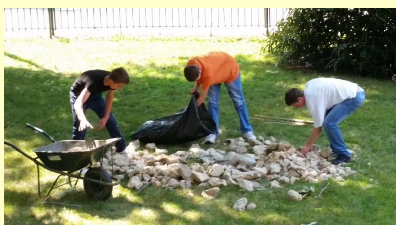
Uređivanje okoliša škole