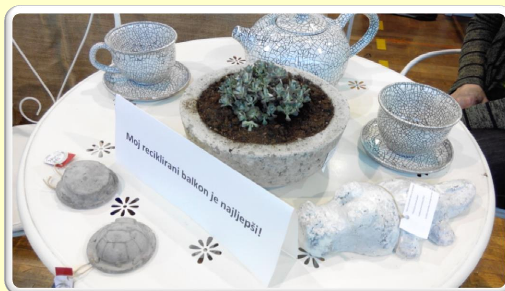
SMOTRA UČENIČKIH ZADRUGA

JAČANJE JAKIH STRANA, KREATIVNIH POTENCIJALA I OSTALIH SPOSOBNOSTI UČENIKA KROZ BROJNE AKTIVNOSTI U ŠKOLI