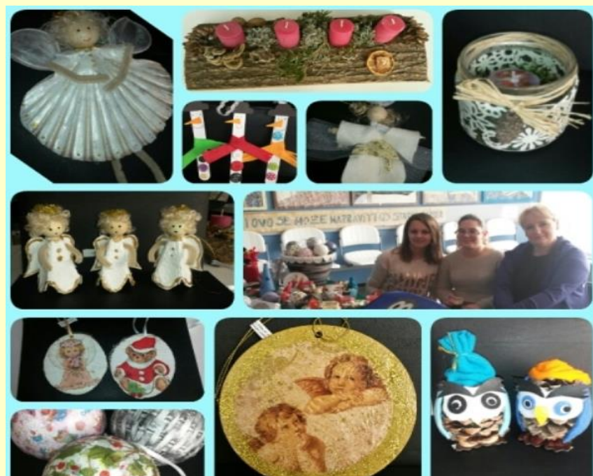
Kreativni pristup u radu